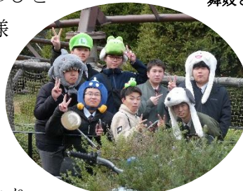
USJにて 楽しんでます