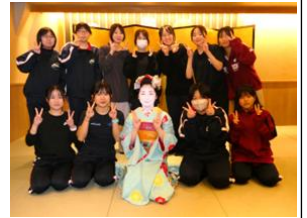
舞妓さんとハイポーズ！